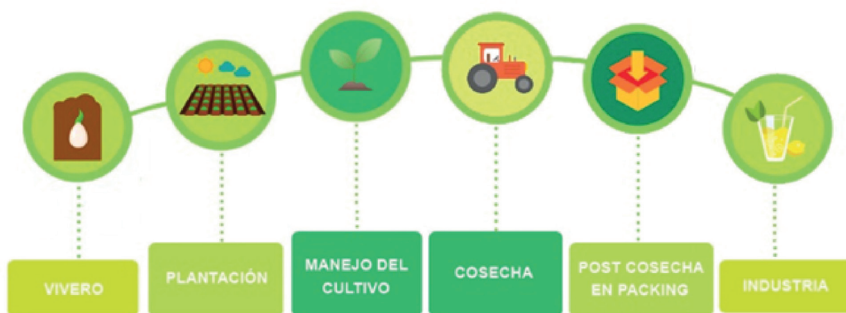
Figura 1. Etapas del sistema productivo del limón