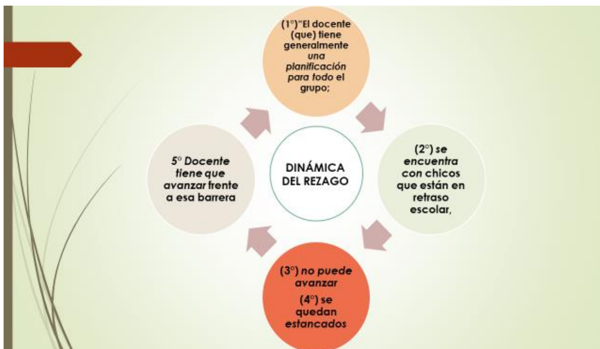
Gráfico 2 Dinámica del rezago en el aula